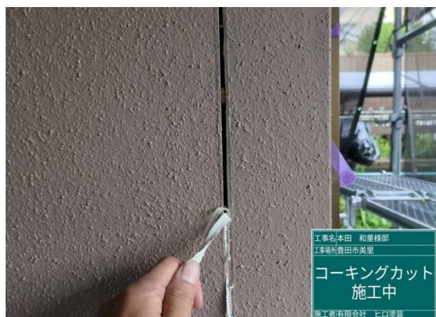
7 既設コーキング 撤去 施工中