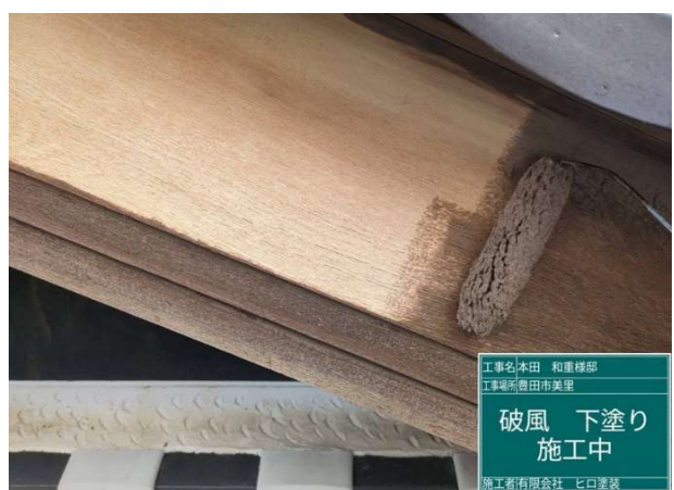
1 7 破風板 下塗り 施工中