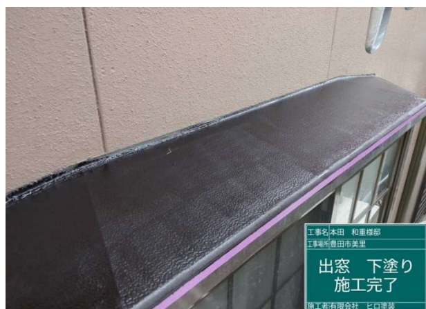
26 出窓 下塗り 施工完了