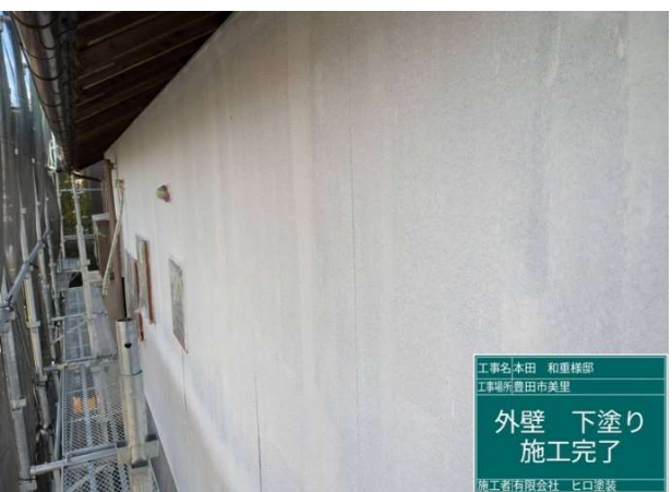
12 外壁 下塗り 施工完了