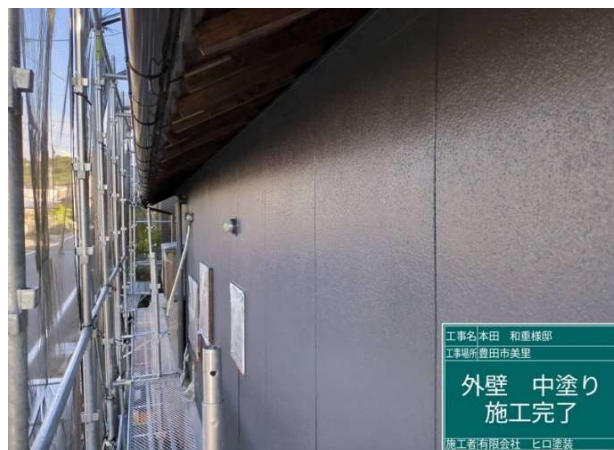
1 4 外壁 中塗り 施工完了