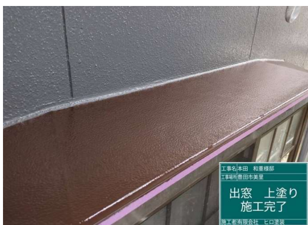
30 出窓 上塗り 施工完了