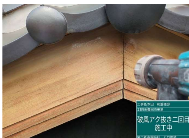
5 破風板 アク抜き 2 回目 施工中