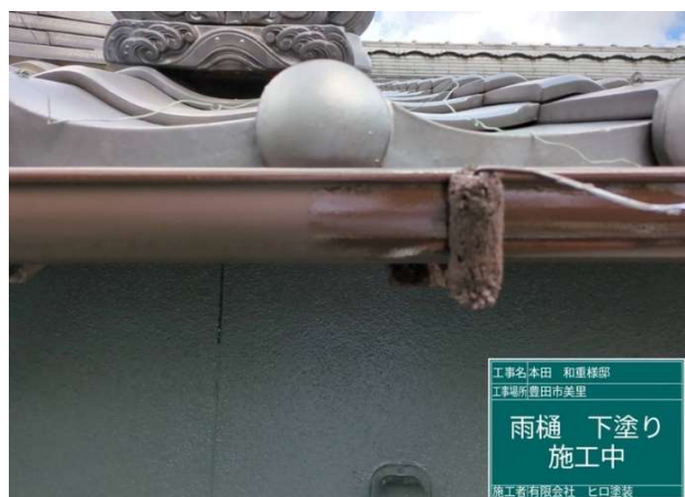
21 雨樋 下塗り 施工中