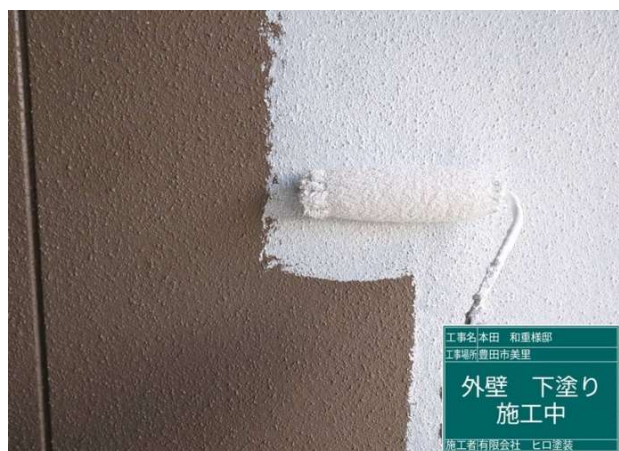
11 外壁 下塗り 施工中