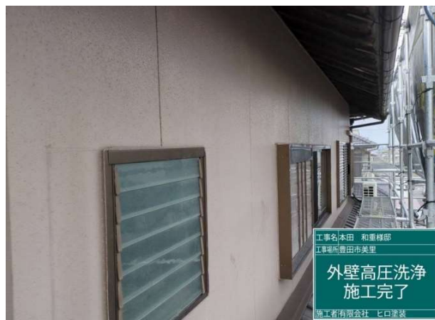
2 高圧洗浄 施工完了