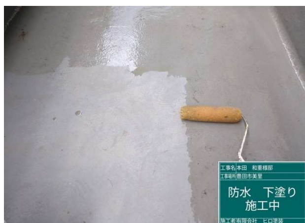
3 5 防水 下塗り 施工中