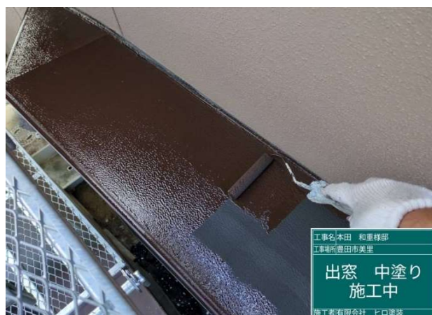
27 出窓 中塗り 施工中