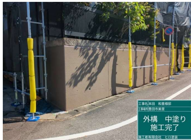
42 外構 中塗り 施工完了