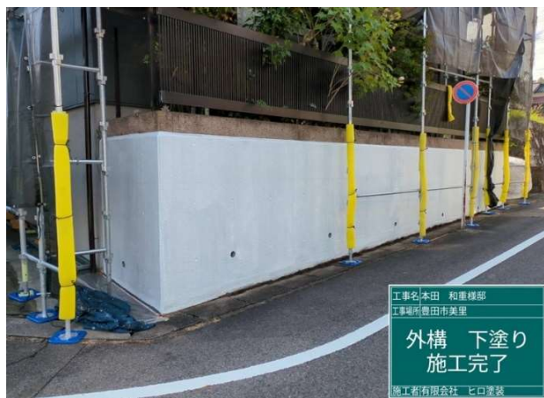
40 外構 下塗り 施工完了