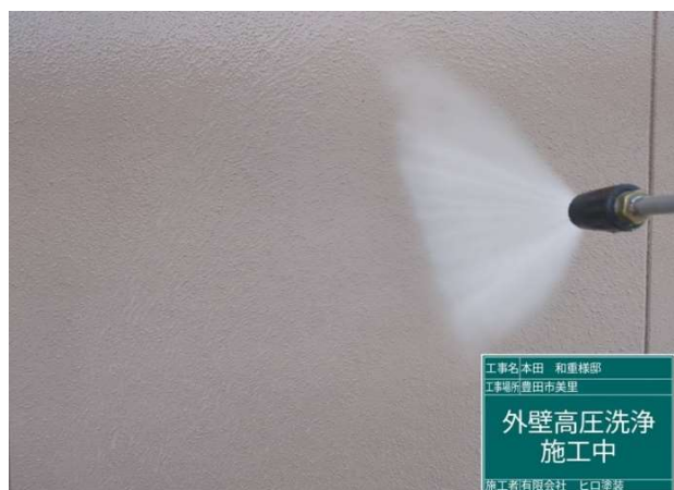
1 高圧洗浄 施工中