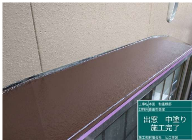
28 出窓 中塗り 施工完了