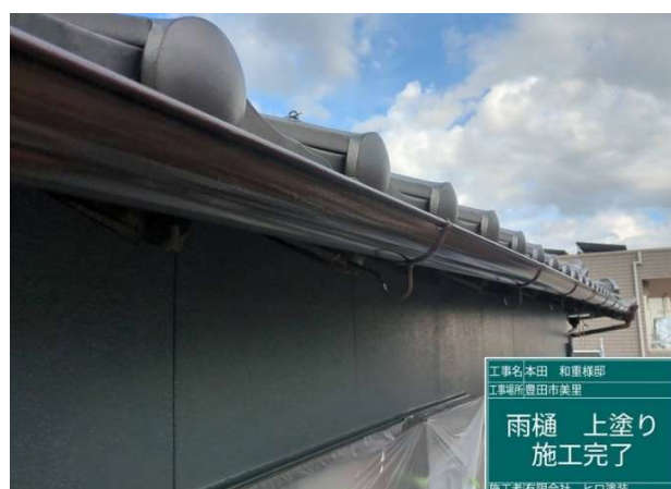
24 雨樋 上塗り 施工中