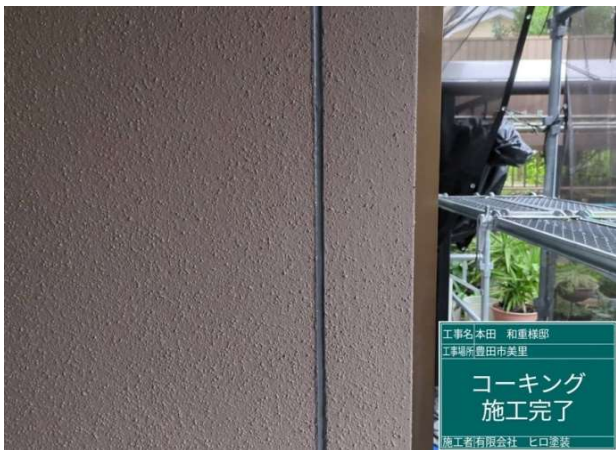
10 コーキング 施工完了