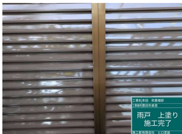
3 4 雨戸 上塗り 施工完了