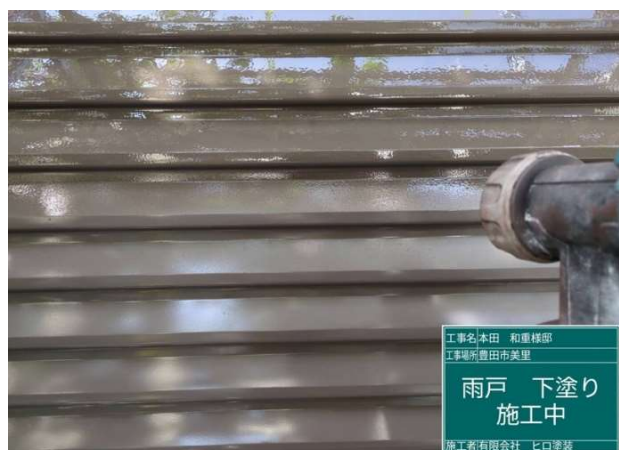
3 1 雨戸 下塗り 施工中