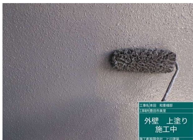
1 5 外壁 上塗り 施工中