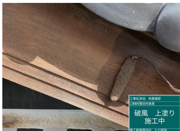
19 破風板 上塗り 施工中