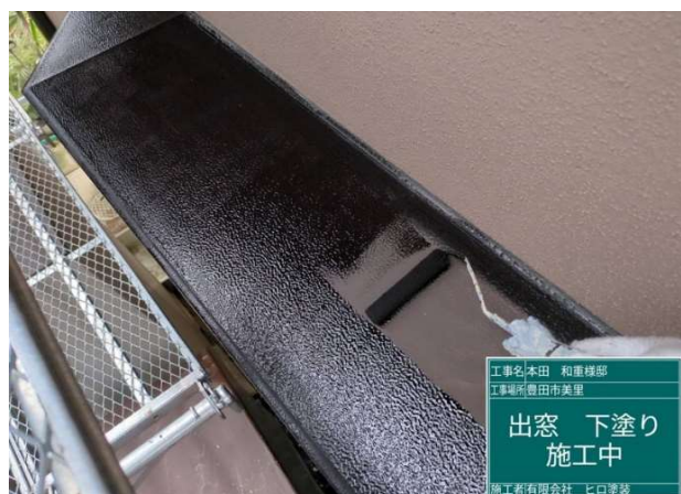
25 出窓 下塗り 施工中