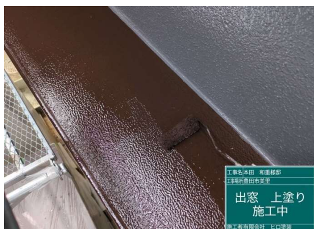
29 出窓 上塗り 施工中