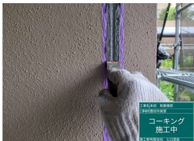
9 コーキング 施工中