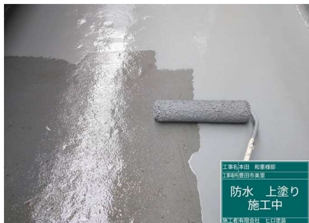
37 防水 上塗り 施工中