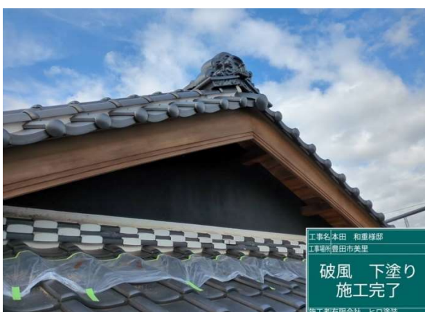
1 8 破風板 下塗り 施工完了