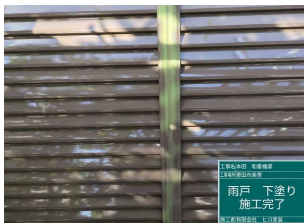
3 2 雨戸 下塗り 施工完了