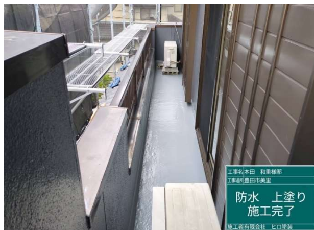
38 防水 上塗り 施工完了