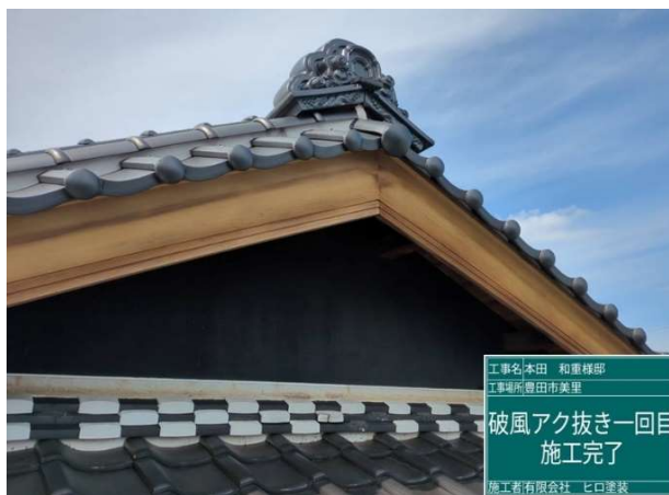
4 破風板 アク抜き 1 回目 施工完了