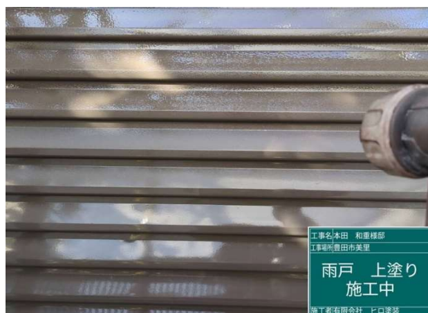
3 3 雨戸 上塗り 施工中