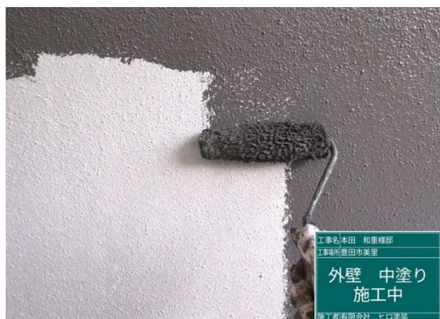
1 3 外壁 中塗り 施工中