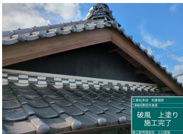
20 破風板 上塗り 施工完了