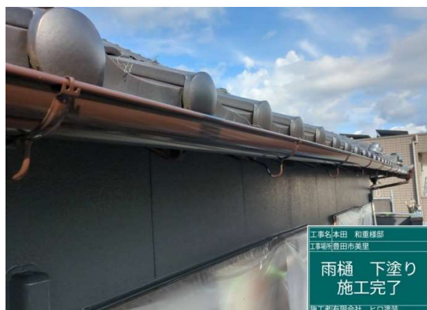
22 雨樋 下塗り 施工完了