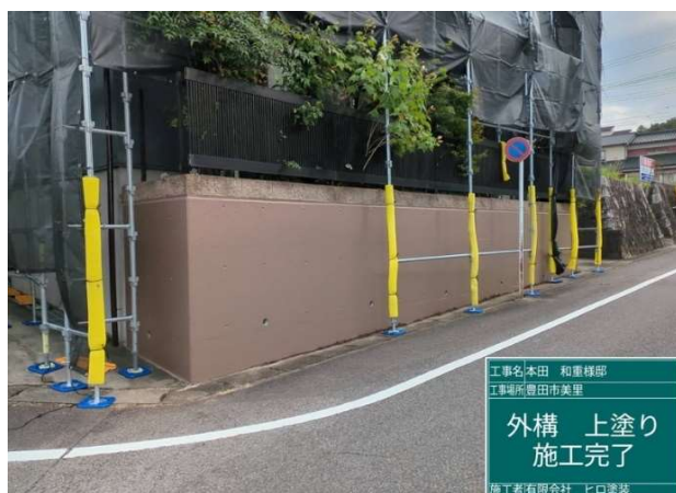
4 4 外構 上塗り 施工完了