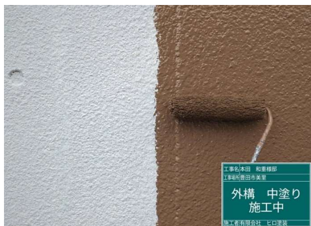
41 外構 中塗り 施工中