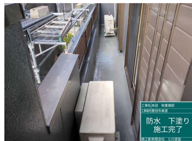
3 6 防水 下塗り 施工完了