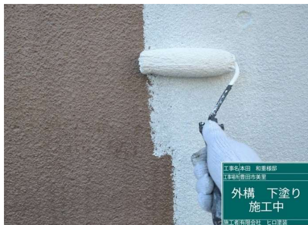
39 外構 下塗り 施工中