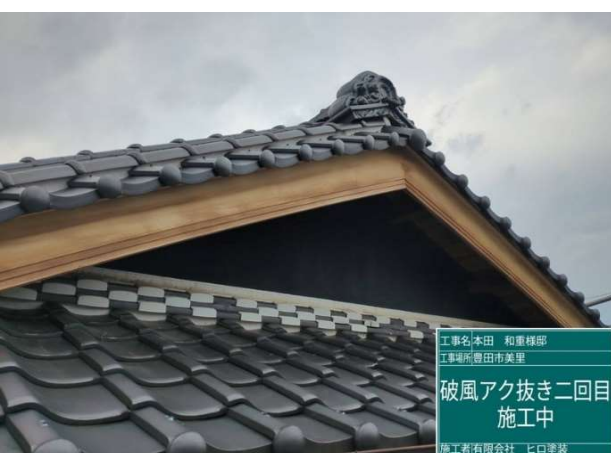
6 破風板 アク抜き 2 回目 施工完了