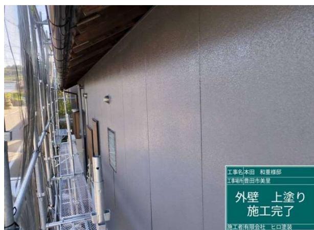
1 6 外壁 上塗り 施工完了