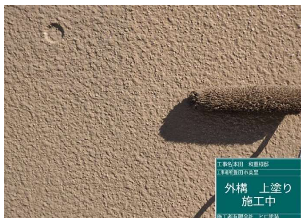
4 3 外構 上塗り 施工中