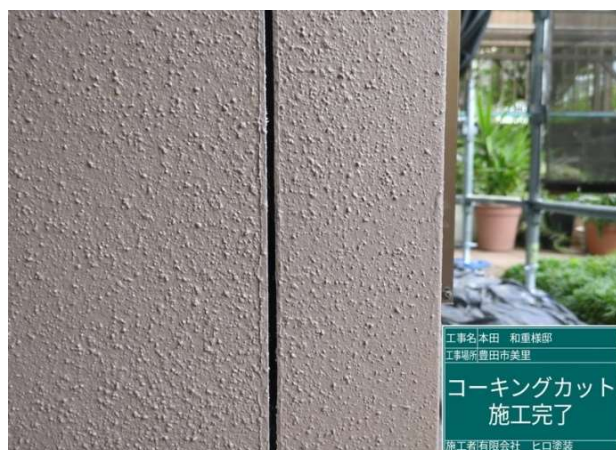
8 既設コーキング 撤去 施工完了