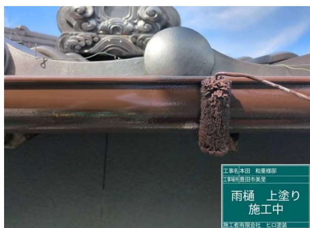
23 雨樋 上塗り 施工中